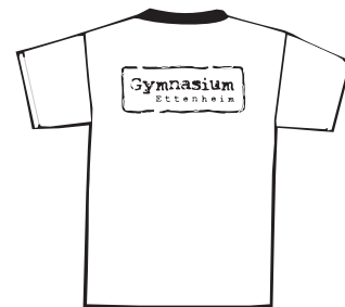
Logo Rücken groß