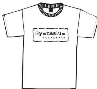
Logo Brust groß